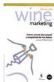
A CURA DI NOMISMA Wine Marketing 2008 Pagine 250 Euro 80,00 ISBN 978-88-6140-030-6