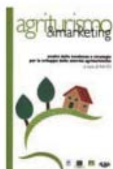
AA.VV. Agriturismo & Marketing Pagine 194 Euro 25,00 ISBN 88-86850-52-2