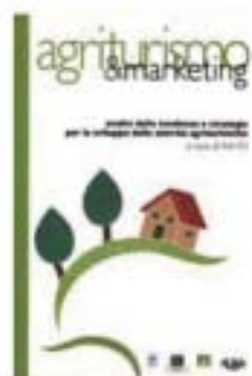
AA.VV. Agriturismo & Marketing Pagine 194 Euro 25,00 ISBN 88-86850-52-2