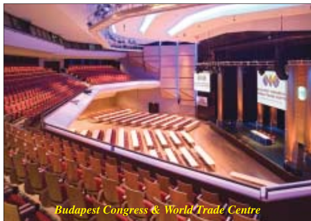
Budapest Congress & World Trade Centre

Despite ongoing construction work, revenues were up 35.6% versus 2005, to a total of 8 million euros. "We are heading in exactly the right direction," said Aufderheide. "We are now going for the big conferences with more than 10,000 participants."