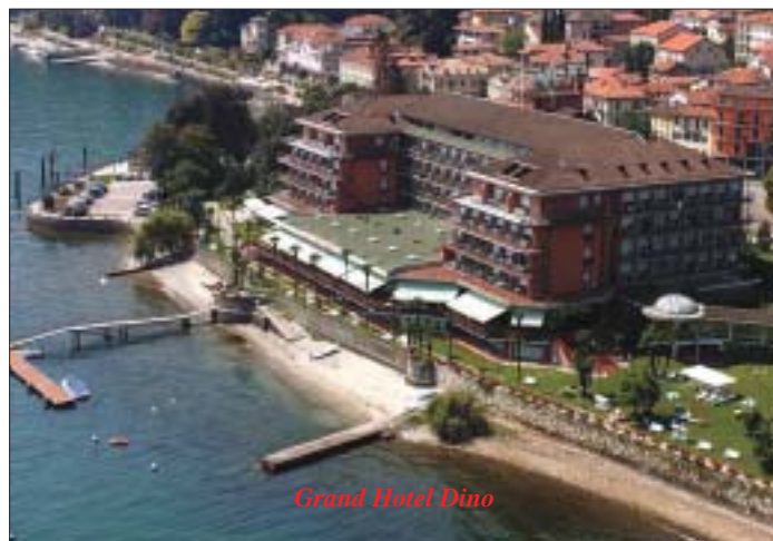
Grand Hotel Dino

Circondato da un parco secolare a pochi metri dal lago, l' Hotel Simplon , con 115 camere, è una location apprezzata da chi cerca tranquillità e relax. Dispone di una bellissima piscina esterna, di due campi da calcetto e, grazie al collegamen-