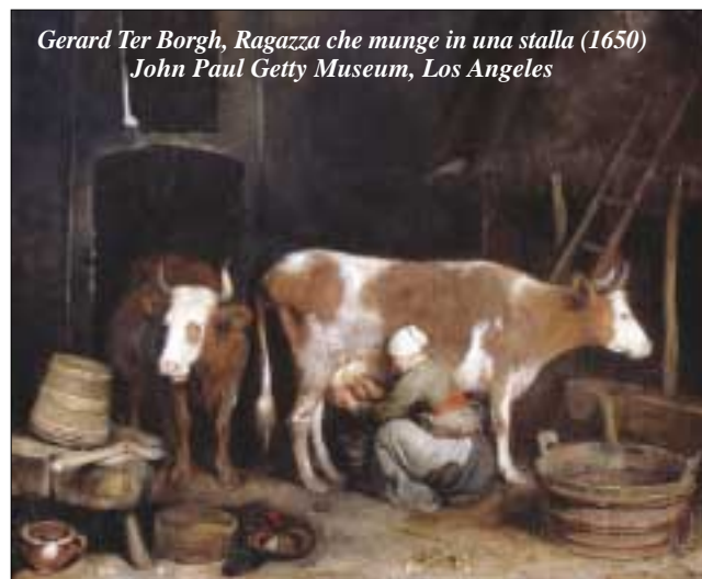
Gerard Ter Borgh, Ragazza che munge in una stalla (1650) John Paul Getty Museum, Los Angeles