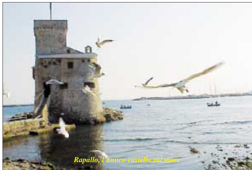
Rapallo, l'antico castello sul mare

Grand Hotel Bristol Via Aurelia Orientale 369 I-16035 Rapallo GE Tel +39.0185.273313 Fax +39.0185.55800 reservation.bri@framon-hotels.it www.framonhotels.com