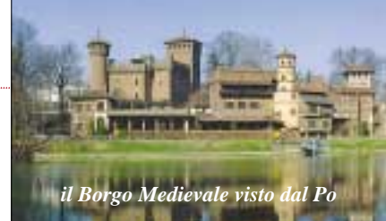
il Borgo Medievale visto dal Po