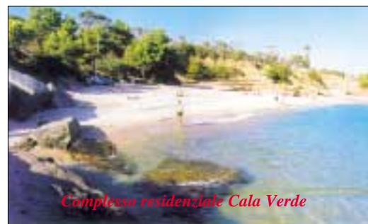
Complesso residenziale Cala Verde

l'isola dei Gabbiani, a soli 5 chilometri da Palau e a 3 dall'esclusivo Porto Raphael, si trova il Residence Wild Surf Costa Serena: 130 appartamenti dotati di patio o terrazzo e di posto auto, con mono, bi e trilocali a 2, 3, 4, 6 e 8 letti. Tra le strutture comuni si contano negozi e supermarket, ristorante e pizzeria, bar, due piscine e due campi da tennis, attracco per imbarcazioni, oltre ad uno spazio attrezzato riservato ai giochi degli ospiti più piccoli. Con 21 euro a settimana ci si assicura ombrellone e sdrai in spiaggia e in piscina, corsi di nuoto, tennis, canoa, ginnastica aerobica, l'utilizzo di tavole da windsurf e l'animazione diurna e serale. L'affitto settimanale di un monolocale a 2 letti costa da 91 a 816 euro, secondo il periodo, un bilocale a 4 posti da 112 a 1.085; culla gratis e sconti fino al 20% se si prenotano due settimane. L'operatore provvede a prenotare, a tariffe agevolate, i traghetti per persone, auto o moto da Genova, La Spezia, Livorno e Civitavecchia per Palau, Golfo Aranci e Olbia, e ai trasferimenti individuali e collettivi sul posto oppure al noleggio di auto, il tutto a tariffe concordate. Per tutta l'estate voli speciali a costi ridotti ogni sabato e martedì su Olbia da Torino, Milano, Bergamo, Verona, Venezia, Bologna, Firenze, Pisa e Napoli.