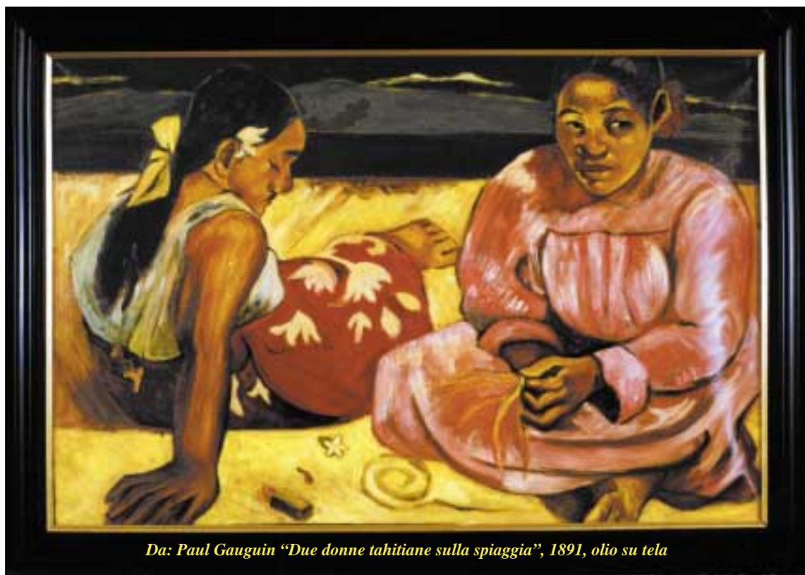
Da: Paul Gauguin "Due donne tahitiane sulla spiaggia", 1891, olio su tela

Opere certificate e garantite, complete di cornice originale in stile